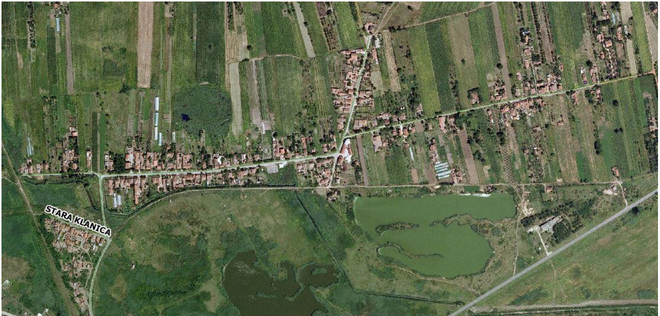
Прегледна ситуација слива СТРЕЛИШТЕ