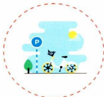
2. korak Parkirati na stanici (označenoj)