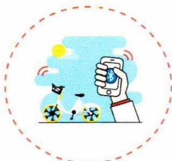
1. korak Otključavanje preko Bluetooth-a

Hardver ovakvog sistema predstavljaju bicikli i sami skuteri. Sofisticirani softver je prilagođen zahtevima krajnjih korisnika i omogućava funkcionisanje svih implementiranih servisa (pristup preko mobilnih aplikacija). Sistem elektronskog rentiranja koristi se u formi umreženja svih bicikala i skutera tako da korisnici preko aplikacije za rentiranje svakog trenutka imaju najbitnije informacije koliko ima slobodnih bicikala/skutera, gde se nalaze, otključavaju i zaključavaju ih preko aplikacije, takođe, preko aplikacije se plaća rentiranje bicikala/skutera. Na slici su prikazani osnovni koraci kako se bicikl/skuter otključava/zaključava preko instalirane aplikacije na telefonu.