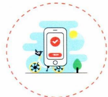
3. korak Preko aplikacije označiti da je bicikl parkiran. Automatski se zaključava.