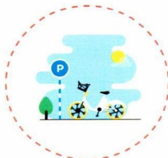
2. korak Parkirati na stanici (označenoj)